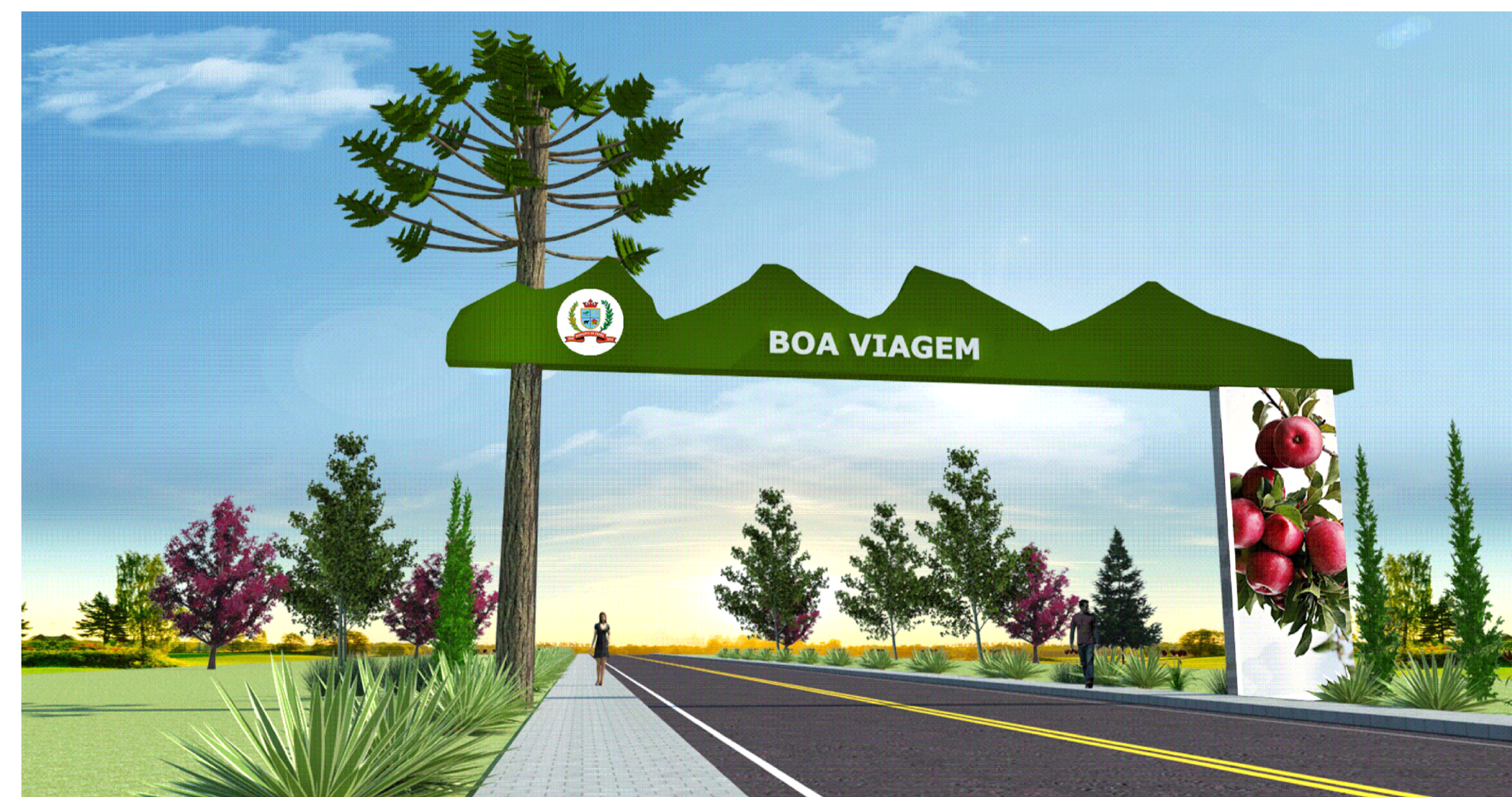
Imagem Saída da Cidade Sem Escala