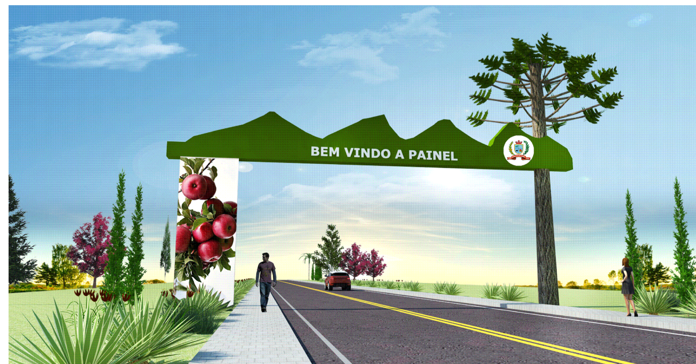
Imagem Entrada da Cidade Sem Escala